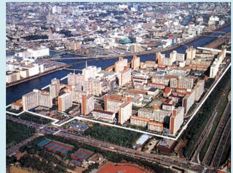
南側から見た品川八潮団地地区外観