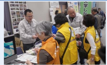
品川清掃工場ブースの様子

当日は、多くの方にご来場いただき、職員が清掃工場のPRを兼ねたクイズを行ったり、園芸栽培セット等の啓発物品を配布しました。