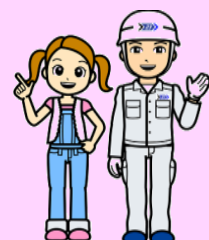
くみちゃんと清掃工場のお兄さん