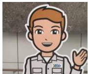
清掃工場のお兄さん