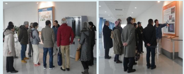
品川区 区政モニターが見学する様子

平成29年2月末現在、品川清掃工場には国内外より3,000人を超える方々が視察・見学に来られました。今後も、工場の取組について、積極的に普及に努めて参ります。